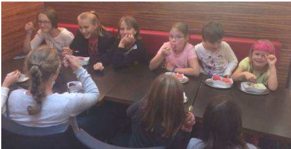
.... der gleich am Donnerstag in der Venezia eingelöst wurde.