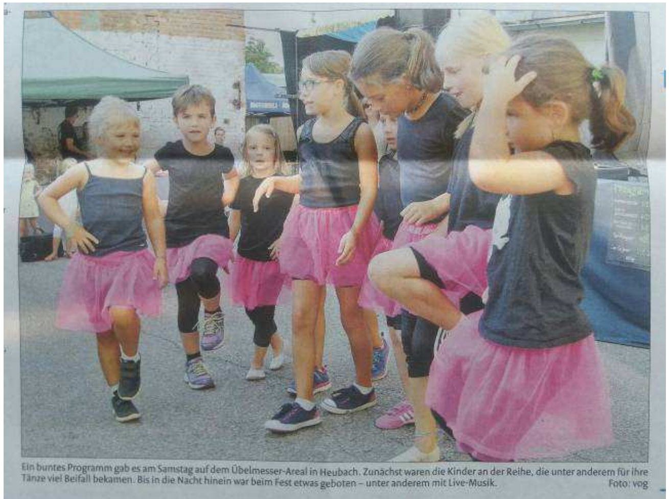
Ein buntes Programm gab es am Samstag auf dem Übelmesser-Areal in Heubach. Zunächst waren die Kinder an der Reihe, die unter anderem für ihre Tänze viel Beifall bekamen. Bis in die Nacht hinein war beim Fest etwas geboten – unter anderem mit Live-Musik.